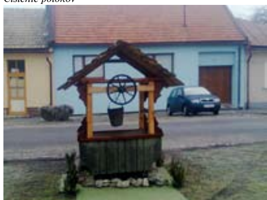
V Hronskej ulici