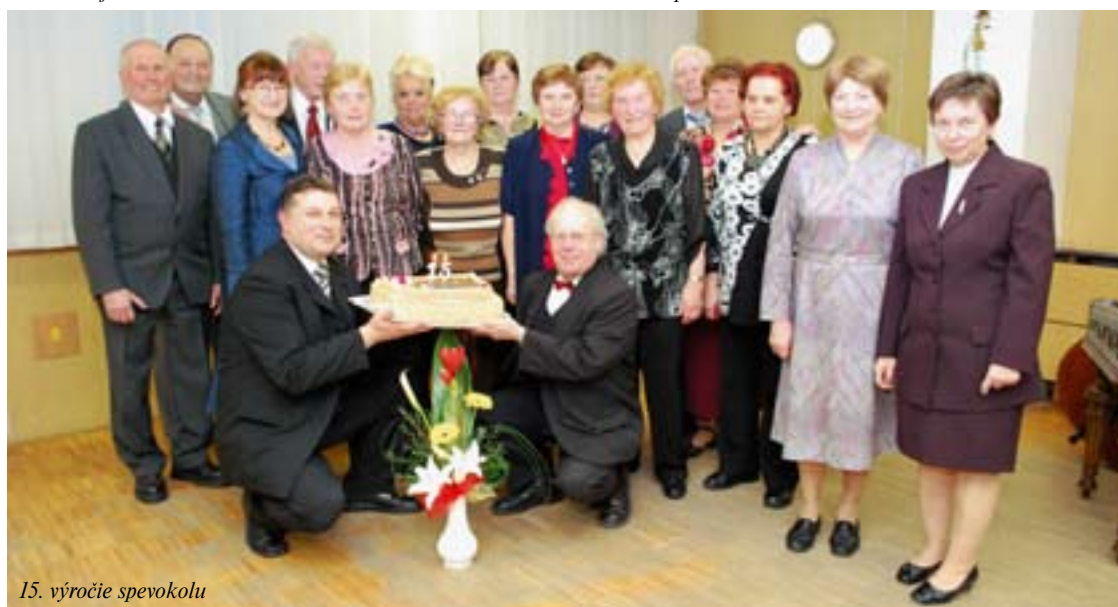
15. výročie spevokolu

Správne znenie tajničky z minulého čísła: Hnilé jablko skazí celý kôš