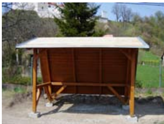
Zastávka pod hradom