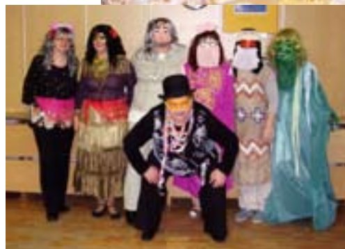
Výbor klubu dôchodcov

V MESIACI MAREC SA VÝZNAMNÝCH ŽIVOTNÝCH JUBILEÍ DOŽILI: