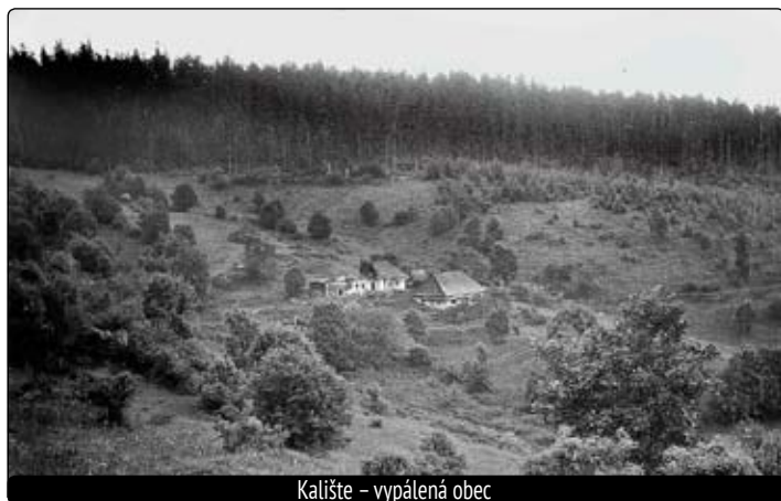
Kalište – vypálená obec