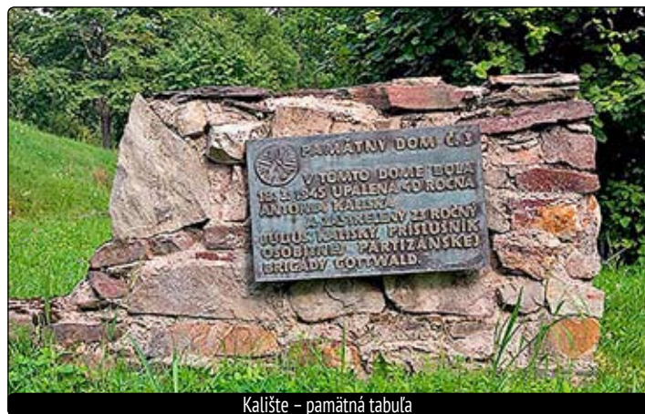
Kalište – pamätná tabuľa