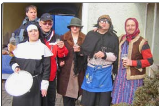
Na fašiangovej zábave