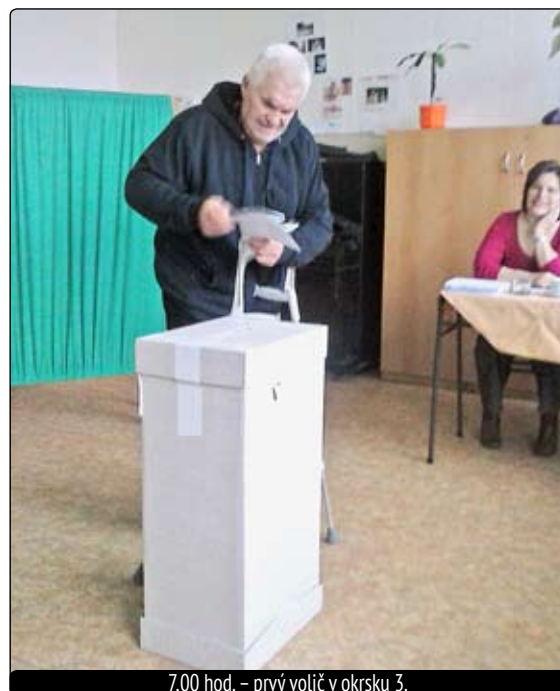
7,00 hod. – prvý volič v okrsku 3.