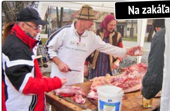
Na zakálačke v Tríbeli