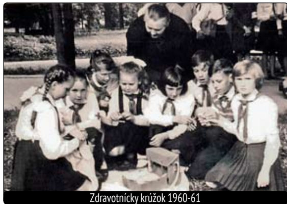
Zdravotnícky krúžok 1960-61