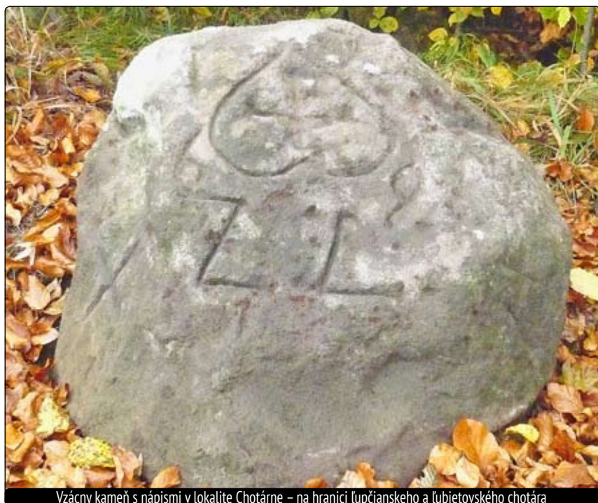
Vzácný kameň s nápismi v lokalite Chotárne – na hranici lupčianskeho a ľubietovského chotára