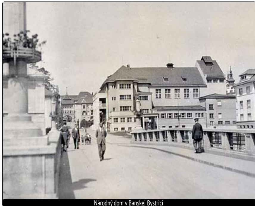
Národný dom v Banskej Bystrici