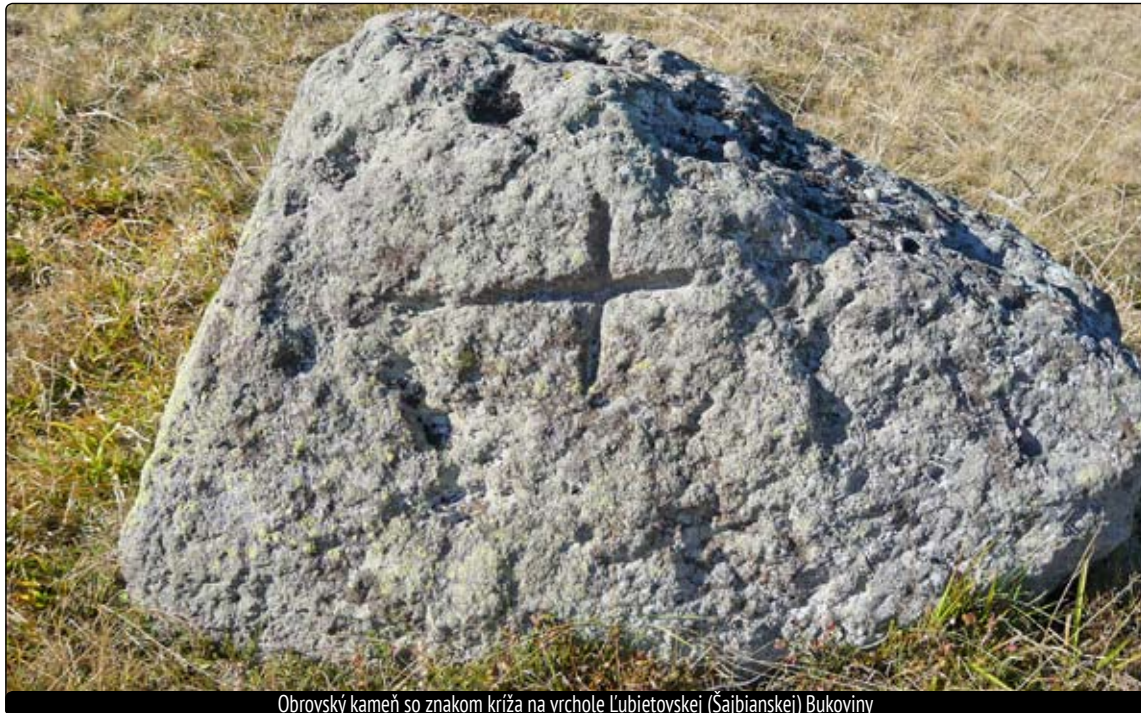
Obrovský kameň so znakom kríža na vrchole Ľubietovskej (Šajbianskej) Bukoviny

Keď v dávnej minulosti dostávali mestecká, obce a osady Uhorska od panovníka výsady a privilégiá, nemohlo v nich chýbať chotárne ohraničenie. Spôsob tohto ohraničenia však nebol jednoduchý a rozhodujúcu úlohu pri ňom zohrávali svedectvá tam žijúcich obyvateľov, ako aj osôb zo širšieho okolia. Vážnosť ich svedectiev závisela od ich spoločenského postavenia a veku. No a keď chýbali akékoľvek písomné doklady, rozhodujúcu rolu zohrali výpovede najstarších svedkov. Hranice chotárov