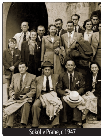
Sokol v Prahe, r. 1947

Obec vstúpila do spoluvlastníctva Sokolovne a tým sa túto krásnu historickú budovu podarilo zachrániť a zachovať aj pre ďalšie generácie športovcov využívajúc Sokolovňu na rôzne druhy športov.