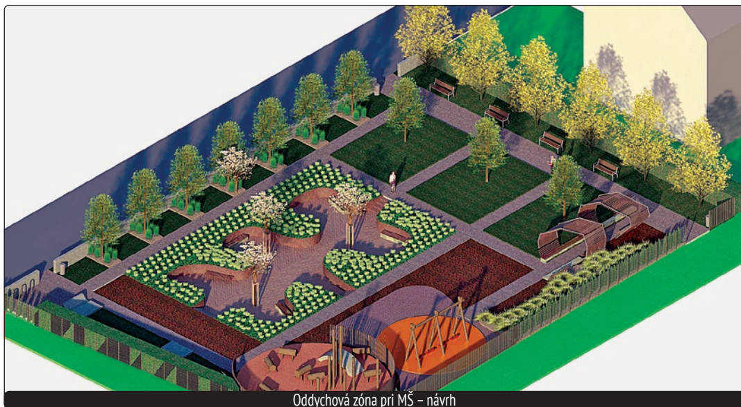
Oddychová zóna pri MŠ - návrh

sudzuje zastavanosť územia. Keď to bude pripravené, tak sa stretneme s občanmi, ktorí tam vlastnia pozemky a budeme riešiť všetky možnosti ako pripraviť lokalitu na výstavbu rodinných domov.