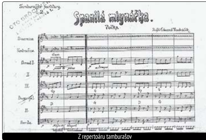
Z repertoáru tamburášov

Doprava bola samostatná kapitola, pretože bola závislá od množstva peňazí, ktoré dokázali rodičia dať svojim deťom na vlak alebo na autobus. Na bližšie trasy sa súbor presúval nákladným autom Praga RND, ktorý bol sponzorsky požičaný od podniku MODROTLAČ Banská Bystrica. Tradičnými šoférmi boli pán Dom alebo pán Gonda. Tento podnik následne financoval časť nákladov a z ušetrného materiálu vyrobili aj rovnošatu s odznakom (bol okráhly s priemerom 8 cm, v strede skratka TSM a pod nimi v polkruhu Tamburáši – modrý podklad).