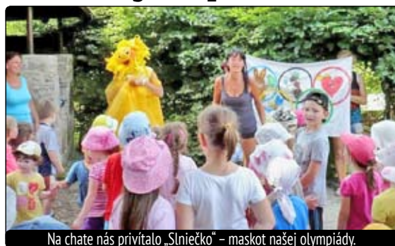
Na chatu nás privítalo „Slniečko“ – maskot našej olympiády.

Úlohou detí bol štafetový beh, spojený s hľadaním pokladu, hádzanie šišiek do diaľky, prekonávanie prírodných a umelých prekážok rôznymi druhmi chôdze, behu a poskokov. Počas prestávok medzi súťažami sa ozýval veselý spev