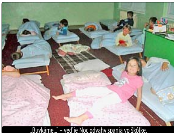
„Buvkáme...“ - veď je Noc odvahy spania vo škôlke.