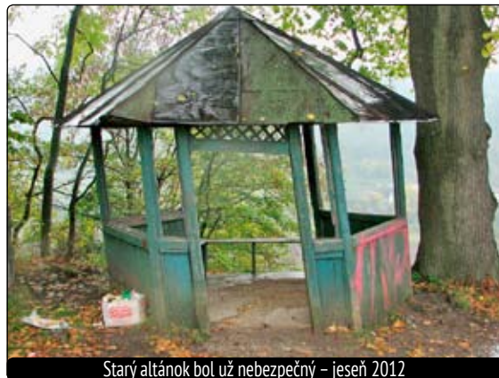
Starý altánok bol už nebezpečný – jeseň 2012