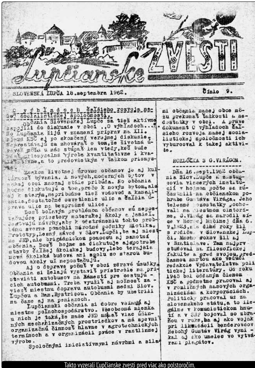
Takto vyzerali Lupčianske zvesti pred viac ako polstoročím.

O čom píšu? Nuž čítajte aspoň malý výňatok: „Znakom životnej úrovne občanov je aj kultúrnosť bývania. A nových, moderných bytov v našej obci naozaj stále pribúda. No občania hojne diskutujú o tom, prečo k novým bytom, ale aj k starým, nepribúda tiež vodovod a kanalizácia, dostatočné osvetlenie ulíc a ďalšia úprava ulíc na bezprašné ulice. Dosť boľavým problémom občanov sú nepostačujúce priestory materskej školy a jasieľ...“ Prešlo viac ako 51 rokov, a ak porovnáme, čím sa zaoberali diskusie obyvateľov Slovenskej Lupče pred polstoročím, a čím sa zaoberajú dnes, máme tu vcelku zrkadlový efekt obecného vývinu. Obecný vodovod čoskoro začne žiadať o svoju rekonštrukčnú daň, stavba kanalizácie si ju už vyberá a prašnosť ulíc zrejme netreba ani komentovať. A rovnako nepostačujúcimi môžeme nazvať aj tie dnešné priestory materskej školy. Ľudia, čo tvoria a verejne publikujú pre obyvateľov obce, a to bez rozdielu doby, boli aj dnes stále sú odhodlaní nielen informovať, ale predovšetkým veci meniť, napríklad aj riešiť. Majú totiž k tomu ten najväčší priestor – obecné noviny. A ako je to v tých našich – súčasných?