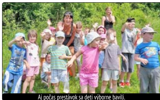
Aj počas prestávok sa deti výborne bavili.

detí, spojený s tancom. Aby sme mali dost síl do športovania, tety kuchárky nám pripravili chutný guláš a ovocný čaj. Na záver boli všetky deti odmenené ozajstnou medailou, sladkou lízankou a zeleným hadíkom z nájdeného pokladu. Atmosféra počas celého dňa bola výborná a my – všetky učiteľky, ale aj nepedagogický personál, ktorý nám veľmi pomohol, sme mali radosť z dobre vydarenej akcie. Zostali nám pekné spomienky, zvečnené na množstve fotografií. Za pekný deň, prežitý na chatu vo Švarci, ďakujeme aj pani Pocklánovej.