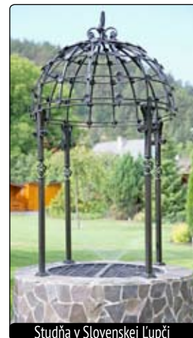
Studňa v Slovenskej Ľupči

Kováčstvo sa považuje za jedno z najstarších remesiel na svete, ktoré by neexistovalo bez základnej suroviny, železa. Historici presne nevedia určiť počiatky remesla, ale prvé železné predmety boli objavené na území dnešného Egypta a Sýrie.