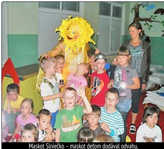
Maskot Slniečko - maskot deťom dodával odvalu.