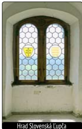
Hrad Slovenská Lupča