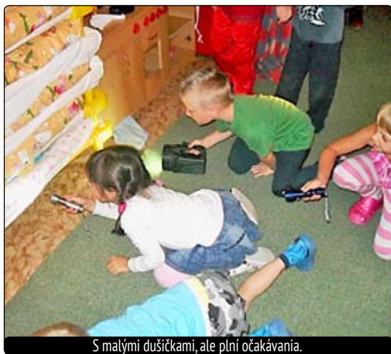
S malými dušičkami, ale plní očakávaní.