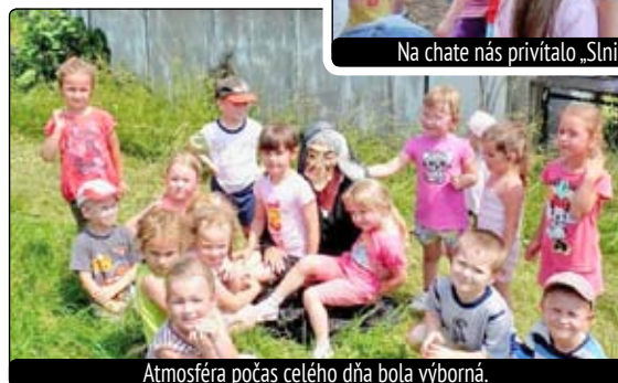
Atmosféra počas celého dňa bola výborná.

Tohtoročný koncoročný výlet sme spojili s letnou školskou olympiádou našej MŠ. V tento deň deti športovo oblečené prichádzali do MŠ, odkiaľ sme sa všetci spolu vybrali veselým krokom, plní nových očakávaní na chatu vo Švarci.