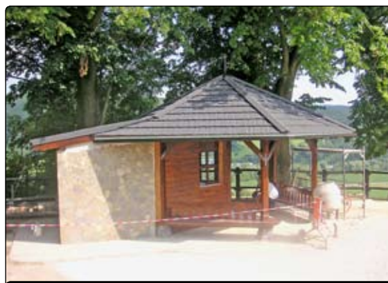
Súčasťou nového altánku budú nielen lavičky, zábradlie, ale aj toaleta