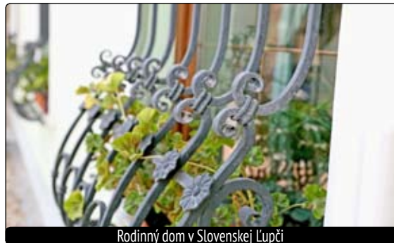
Rodinný dom v Slovenskej Ľupči