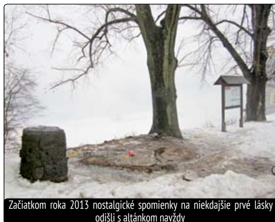
Začiatkom roka 2013 nostalgické spomienky na niekdajšie prvé lásky odišli s altánkom navždy