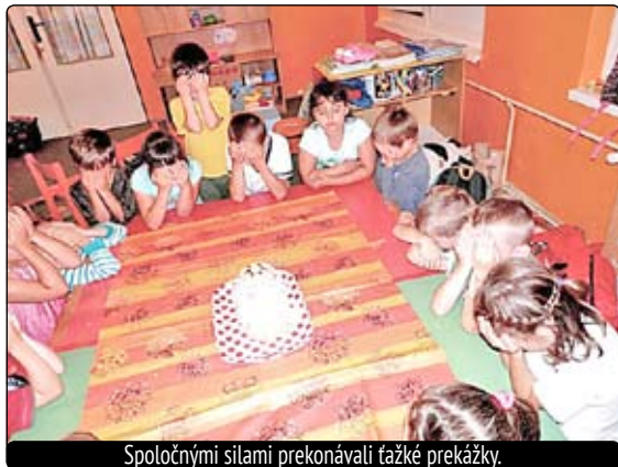
Spoločnými silami prekonávali ťažké prekážky.

Spoločnými silami prekonávali ťažké prekážky, ktoré preverili ich vedomosti, zručnosti a odvalu. Úspeš-