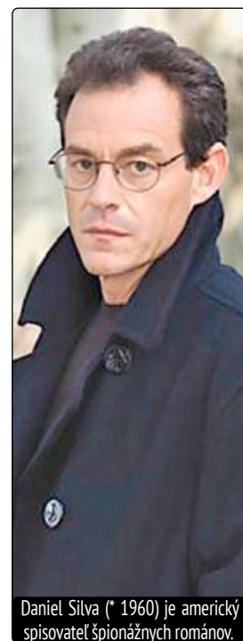
Daniel Silva (* 1960) je americký spisovateľ špionážnych románov.