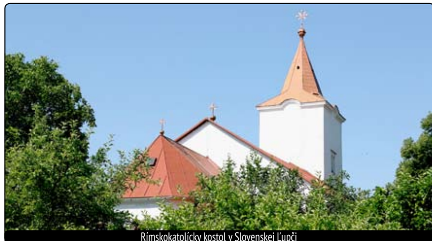
Rímskokatolícky kostol v Slovenskej Ľupči

stor. Vytavené železo bolo materiálom pre kováčov, ktorých práca mala pre vtedajšiu spoločnosť základný význam a bola vysoko cenená. Každá dedina mala svojho kováča, ktorý zväčša robil prácu, prinášajúcu úžitok, ako výroba roľníckych a remeselných nástrojov a potrieb pre domácnosť. Umelecké výrobky mohli robiť iba kvalifikovaní majstri z kováčskeho cechu.