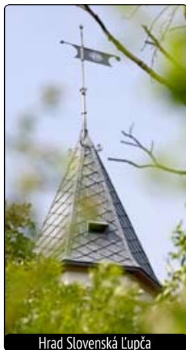
Hrad Slovenská Lupča