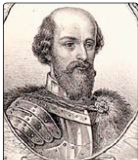
Matúš Trenčiansky Po roku 1310 hrad zaujal mocný veľmož Matúš Čák Trenčiansky.

Až po roku 1310 hrad zaujal Matúš Čák Trenčiansky. Bol to mocný a bohatý veľ-