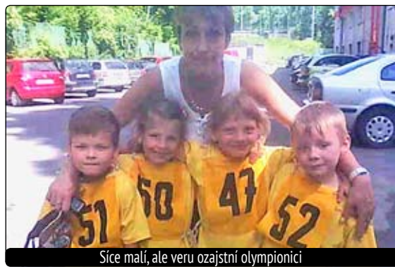
Síce malí, ale veru ozajstní olympionici