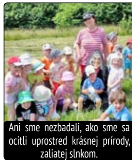
Ani sme nezbadali, ako sme sa ocitli uprostred krásnej prírody, zaliatej slnkom.