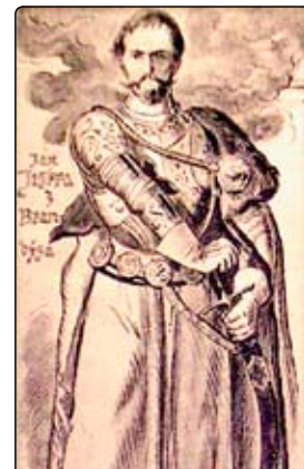
Bratřícký kapitán Ján Jiskra z Brandýsa dostal do správy viaceré slovenské hrady.