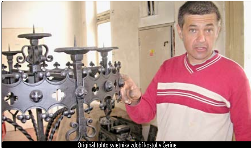
Originál tohto svietnika zdobí kostol v Čeríne