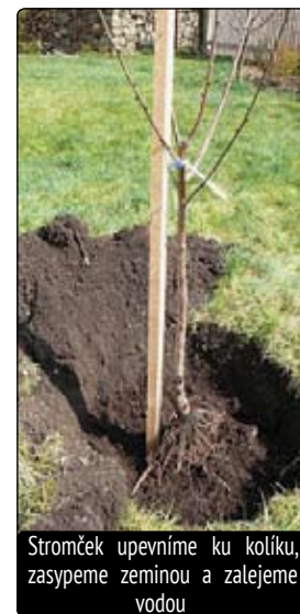
Stromček upevníme ku kolíku, zasypeme zeminou a zalejeme vodou

púčik ale musí ostať. Môže sa nachádzať na spodku konárika alebo vpravo. Vždy správnym smerom. Na konári z púčikov vyrastajú ružice a z nich výhonky, ktoré zaštipujeme koncom júna. Čo narastie ďalej, odstránime koncom augusta. Tak na konárik narastú púčiky, ktoré sa nasledujúci rok premenia na kvetné púčiky. Dosiachneme tak želanú rodivosť stromčeka. Ak postup dodržíme, zamedzíme zmrznutiu porastu, lebo polozelené výhonky vyzrejú na tvrdé drevo. Takýmto spôsobom môžeme pestovať broskyne, marhule, slivky a čerešne, no aj jadrové stromy. Nezabudnime u odrôd kôstkovitých, že mladé výhonky, ktoré sa koncom augusta nezakrátia, cez zimu zamrznú. Práve na týchto jednoročných výhonkoch rastie najkvalit-