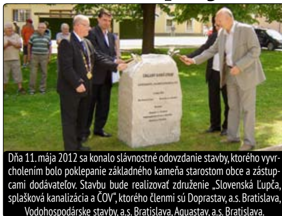
Dňa 11. mája 2012 sa konalo slávnostné odovzdanie stavby, ktorého vyvrcholením bolo poklepanie základného kameňa starostom obce a zástupcami dodávateľov. Stavbu bude realizovať združenie „Slovenská Lupča, splašková kanalizácia a ČOV“, ktorého členmi sú Doprastav, a.s. Bratislava, Vodohospodárske stavby, a.s. Bratislava, Aquastav, a.s. Bratislava.

Slávnostným poklepaním základného kameňa, ktorý je iba dočasne osadený v parku oproti obecnému úradu, sa 11. mája korunovalo niekoľkoročné úsilie našej obce o získanie finančnej dotácie na rekonštrukciu a výstavbu kanalizácie a čističky odpadových vôd pre celú našu obec. Splňte si tak povinnosť odkanalizovať obec a vybudovať centrálnu čistiareň odpadových vôd.