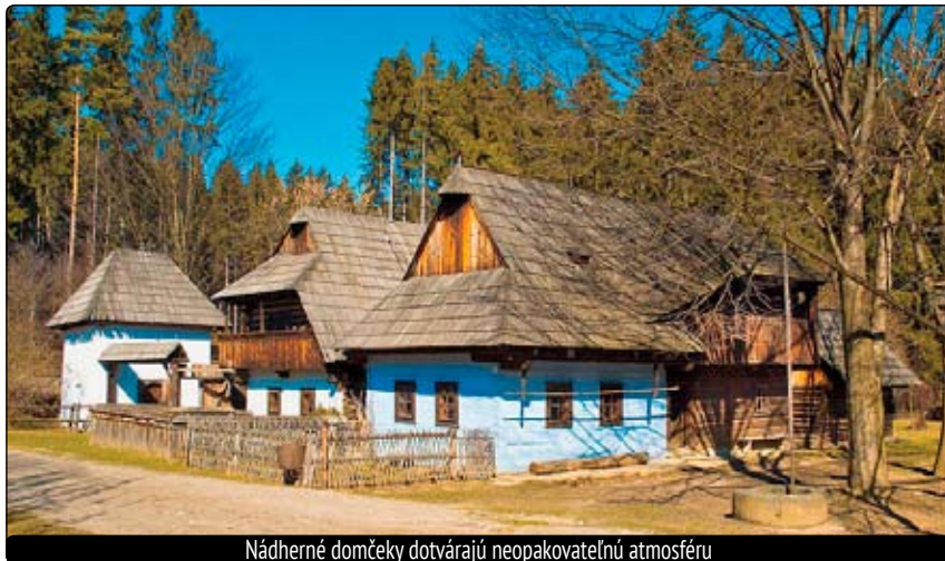
Nádherne domčeky dotvárajú neopakovateľnú atmosféru

Kedže začína leto, čas rodinných, ale aj školských výletov a, samozrejme, o mesiac sú sladké prázdniny, dovoľm si upriamiť vašu pozornosť na výlety vhodné pre rodičov s deťmi a možno dať aj tip pre našich učiteľov pri plánovaní školských výletov.