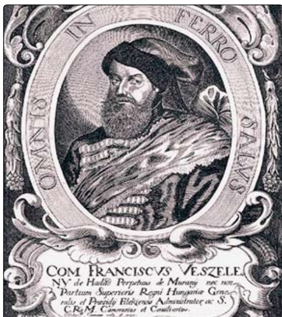
Kruhopic na medirytine hlása: Gróf František Wesselényi z Hadadu, dedičný pán Muráňa, administrátor a predstavený na hrade Filakovo, dvorný radca svätého cisárskeho a kráľovského majestátu a najvyšší generál čiasok Horného Uhorska. Podobizeň vznikla v roku 1649 pri príležitosti Wesselényiho vymenovania za hornouhorského kapitána. Latinské heslo v dolnej časti by malo byť krédom zobrazeného a znie: „Čo treba spraviť, neslobodno odkladať.“