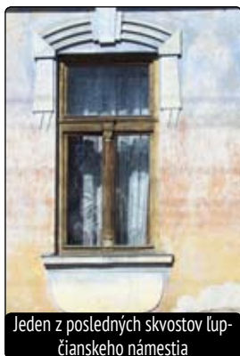
Jeden z posledných skvostov lupčianskeho námestia

vadia ani pútače hyzdiace námestie. Obzvlášť „vkusný“ je pútač pred katolíckym kostolom, o ktorý sa veriaci, ponáhľajúci sa na