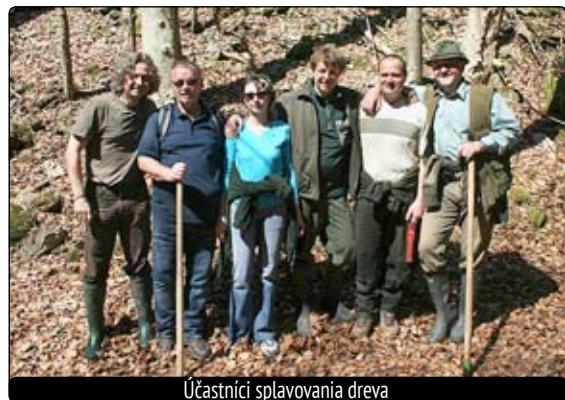
Účastníci splavovania dreva

Polícia ďakuje všetkým občanom obce Slovenská Lupča ako aj návštevníkom „Turičného jarmoku“ za rešpektovanie pokynov príslušníkov polície ako aj za bezproblémový priebeh celého jarmoku a verí, že aj kultúrno-spoločenské akcie, organizované v budúcnosti v obci, budú mať rovnaký pokojný priebeh. (pm)