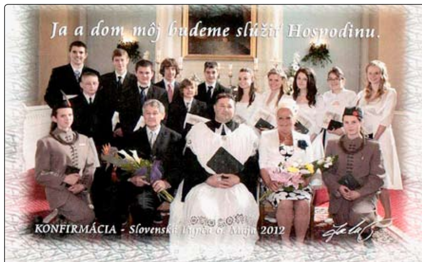
KONFIRMÁCIA - Slovenská Lupča 6. mája 2012

zrejmosťou aj príprava detí. Po tejto príprave sa deti deň pred konfirmáciou stretli na skúške a po nej si spoločne posedeli s evanjelickým pánom farárom a mohli sa pri sladkej torte navzájom viac spoznať.