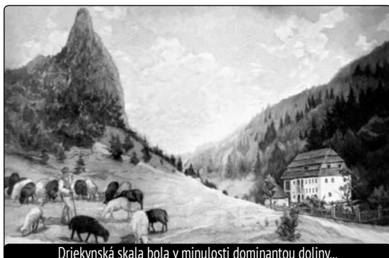
Driekynská skala bola v minulosti dominantou doliny...

Doba sa zmenila. Po mestí jazdia i parkujú kamióny, rodičia sa boja deti pustiť na ulicu. Krása starých domov sa postupne vytráca, vyrezávané brány nahradili plechové, štukové ozdoby okolo drevených okien museli uvoľniť priestor plastovým oknám. Čaro lupčianskeho námestia sa vytráca. Ako pász na oko dostalo námestie ranu len nedávno v podobe obrovského nápisu SUPERMARKET. Schválne som čakal, či niekto na „ozdobu námestia“ zareaguje. No, nikto. Dokonca nám ne-