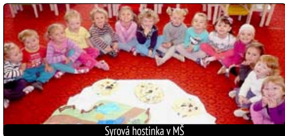
Syrová hostinka v MŠ