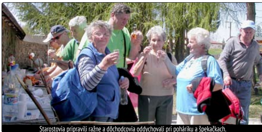
Starostovia pripravili ražne a dôchodcovia oddychovali pri poháriku a špekačkách.

sme sa zišli v areáli reštaurácie na Šachtičkách pri ohnisku, kde si každý sám opiekol pripravené špekačky – ešte aj ražne nám starostovia pripravili! Bolo príjemné sledovať zúčastnených dôchodcov, ako si vymieňajú skúsenosti zo svojich túr a plánujú ďalšie spoločné akcie. Pri víniku či poháriku hruškovice si spríjemnili slnečnú sobotu. Niektorí boli už naozaj v obdivuhodnom veku a mne preletelo hlavou – keby aj mne tak zdravíčko slúžilo, aby som mohla v takom veku aktívne prežívať zaslúžené dôchodok. (id)