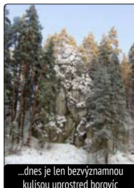
...dnes je len bezvýznamnou kulisou uprostred borovic

Chceme, aby naša obec bola atraktívna pre návštevníka aj príjemná pre nás obyvateľov? Sú medzi nami