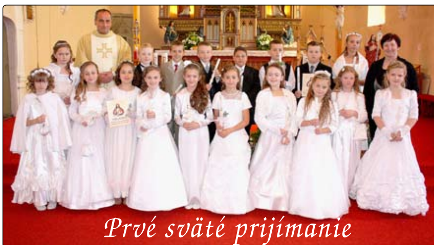
Prvé sväté prijímanie

piť k Večeri Pánovej a prijať túto sviatosť. Zároveň to znamená slávnostne prijať deti za dospelých kresťanov cirkvi. Ak hľadáme na ňu v súvislosti s krstom, potom konfirmácia je príležitosťou, keď dorastajúce dieťa vyzná, že spoznalo a spoznáva milosť, ktorú prijalo vo svojom krste a že v tejto milosti chce naďalej zotrvať. Konfirmácia je aj podmienkou pristupovať k Večeri Pánovej. V oboch cirkvách je samo-