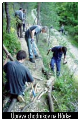
Úprava chodníkov na Hôrke