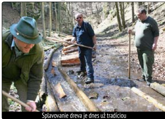
Splavovanie dreva je dnes už tradíciou

Rizňovanie alebo tiež splavovanie dreva bolo kedysi rozšírené najmä po strednom Slovensku a veľmi intenzívne ho využívali v okolí Harmanca. Drevené vodné žlaby (tzv. rizne) boli známe nielen značnou dĺžkou, ale aj funkčnosťou aj pri veľmi malom prietoku vody. Metrovica po vložení do žlabu posunovali lesní robotníci, v údolí ju zachytávali a ukládali do siah.