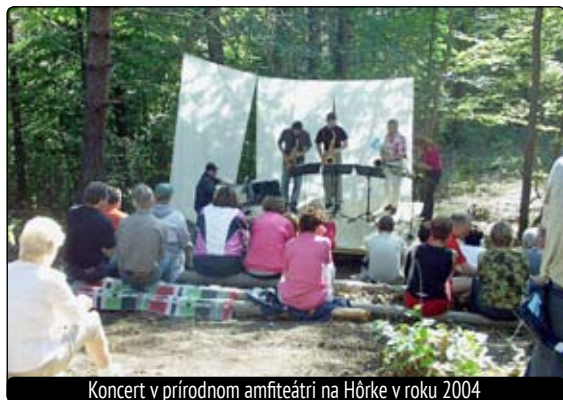
Koncert v prírodnom amfiteátri na Hôrke v roku 2004