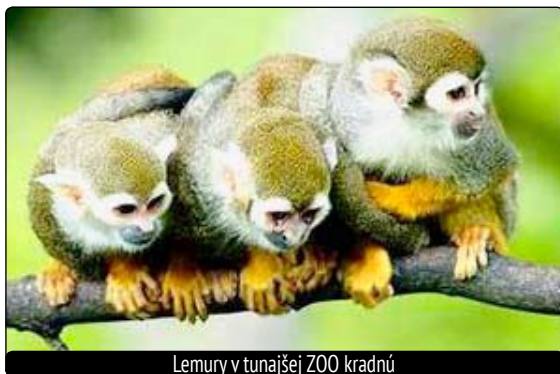
Lemury v tunajšej ZOO kradnú

Zvieratá sú aj voľne prístupné. Levy sú vonku v priestore oddelene vodným kanálom a tenkým elektrickým drôtom, a tak sa vám zdá, že ste takmer medzi nimi. Medzi lemury nevhádzajte s jedlom v ruke, ony totiž kradnú. Dokonca som bola svedkom, ako si vytiahli trs