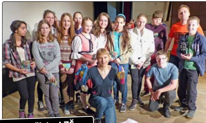
Foto našej olympioničky so žiakmi ZŠ