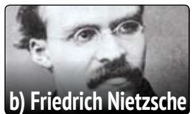
b) Friedrich Nietzsche