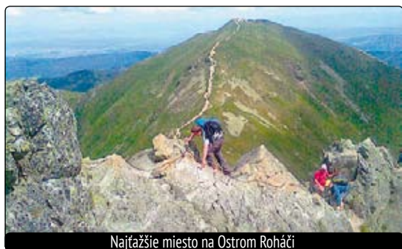
Najťažšie miesto na Ostrom Roháci

MÁJ - pred Servácom niet leta, po Serváci niet mrazu.