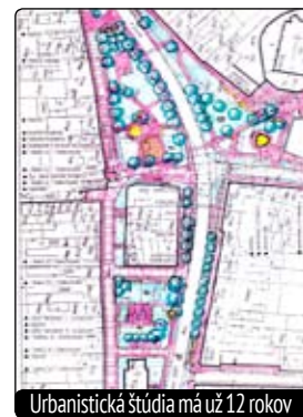
Urbanistické štúdiá má už 12 rokov

ty. Tie však podľa slov architekta zadané neboli a práve ony sú potrebné na vybavenie stavebného povolenia, a tým pádom aj na žiadanie o financie z európskych fondov. Podľa veľmi nepresných odhadov by investícia na celý projekt dosahovala čiastku od 1,9 do 2,5 milióna eur. A čo by sa mohlo realizovať ako prvé? „Jednoznačne by mala ísť do úprav zóna okolo MKS, ktorú je možné podľa projektu realizovať za jedno leto,“ domnieva sa architekt a dodáva, že potrebná suma by tu nepresiahla 200-300 tisíc eur. Kam by sa tým Lupča