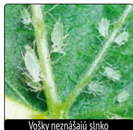
Vošky neznášajú slnko

Poznáme viac druhov odrôd malín - jednorodé a dvojrodé. Jednorodé maliny rodia raz za rok. Na výhone, ktorý narástol v lete, budú rodiť na budúci rok.