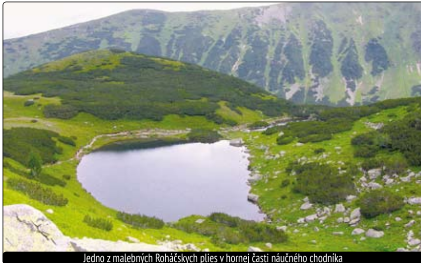
Jedno z malebných Roháčskych plies v hornej časti náučného chodníka

Charakteristickými „rohovitými“ vrchmi, podľa ktorých sa volajú, sú Ostrý Roháč (2084 m) a Plačlivé (2126 m) so svojimi divoko rozorvanými štítmi. Najznámejším turistickým strediskom je Podbanské, Pribylina, Račkova a Žiariska dolina, Zverovka a Oravice, kde je mimochodom aj termálne kúpalisko asi 10 km od Habovky. Vyhľadávaný je náučný chodník Roháčske plesá – Štátna prírodná rezervácia. Prístup je Roháčskou dolinou zo Zverovky, kde je možné odstaviť auto na parkovisku. Po prvýkrát, keď sme sem prišli, ma skutočne ohúrila krása tejto časti hôr, a to už pri vstupe do doliny, ktorou vedie pohodlná asfaltová