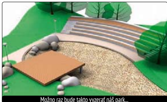
Možno raz bude takto vyzerat náš park...

Jednu takú, čo „padla do zabudnutia“, vypracoval a obci daroval tím architektov