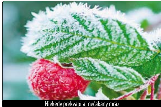
Niekedy prekvapí aj nečakaný mráz

narastené hrčky. Nenechajte ich do jari na budúci rok! Keď maliny zakvitnú, okamžite na ne začnú liezť veľké mravce a nanášajú na ne vošky mravenčie. Ak tomu nezabráňime, mravce na kvetných výhonoch skrúcajú listy okolo kvetov a nasadia na kvety a listy vošky, ktoré vyrábajú pre ne kyselinu mravčiu. Z vošiek narastú húsenice a zožerú celé súkvetie aj listy. Je po úrode. Moja rada proti mravcom - okolo kvetov odstrihujem koncové listy pri súkvetí malín. Mravce tak nedokážu súkvetie malín obaliť listami. Vošky neznášajú slnečné svetlo. Preto sa na slnkom osvetlených miestach neudržia. Čo s egrešmi? Americká múčnatka egrešová je ich vážnou chorobou. Znižuje ich odolnosť proti zime. Ovplyvňuje úrodnosť