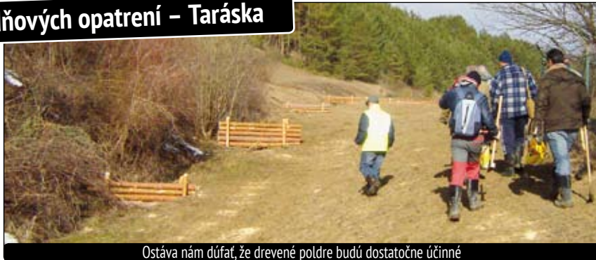
Ostáva nám dúfať, že drevené poldre budú dostatočne účinné

Koncom minulého roka starosta podpísal spoluprácu s firmou Xanto Zvolen, ktorá vypracovala návrh na vybudovanie drevených poldrov v časti Taráska – pri skokanských mostíkoch. Po výzve z Úradu vlády SR starosta vypracoval a podal žiadosť o dotáciu a následne v druhom kole bola obec