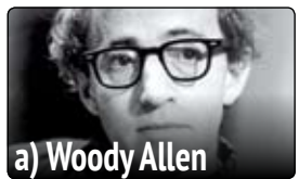
a) Woody Allen