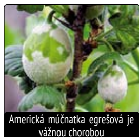
Americká múčnatka egrešová je vážnou chorobou

Dvojrodé maliny rodia tohoročné výhony v auguste až do konca septembra, ako prvú úrodu. Na budúci rok v lete rodia znovu na tom istom výhone, čo rodili v jeseni. Odrodené výhony ľahko poznáme podľa toho, že po odrodení vysychajú. Odstraňujeme ich tesne nad zemou záhradkárskymi nožnicami. Chorobou napadnuté výhony malín odstraňujeme hneď na jeseň. Je jedno, či sú jednorodé alebo dvojrodé druhy. Napadnuté výhony majú