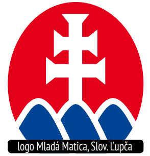
Logo Mladá Matica, Slov. Ľupča

Dovoľme deťom žiť to, čo naozaj cítia Lupčiansky dvojkríž na Hôrke sa ocitol aj na titulke celoslovenského mesačníka. Že by uverejnený nápis pod ním nahrával myšlienke Mladých maticiarov?