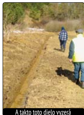
A takto toto dielo vyzerá

Taráska je lokalita v blízkosti bývalých skokanských mostíkov. Pri príválových alebo výdatných dažďoch nestačí prírodou vytvorený potôčik – jarok pretekajúci cez uvedené záhrady odvádzať vodu a vylieva sa do záhrad alebo domov stojacich v záhradách. Niekoľ-