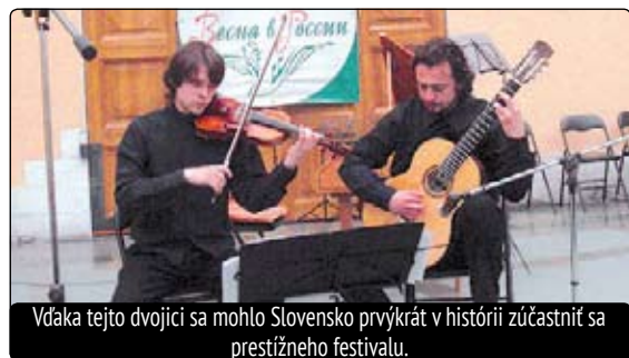
Vďaka tejto dvojici sa mohlo Slovensko prvýkrát v histórii zúčastniť sa prestížneho festivalu.

ľudí!“ A o dvadsať minút: „Tak čo, chlapci, páčilo sa? To nie je ako Blava, tu je 25 miliónov ľudí!“ Pobavení sme sa rozlúčili a nasadli na vlak smer letisko Vnukovo. Tešili sme sa z úspechu a bezproblémového priebehu nášho krátkeho pobytu v Rusku. Nevrav hop, kým nepreskočíš! Stále som mal na pleci niečo, čomu sa vraví husle a pred sebou červenú zónu pre extra prípady. Pri detektore ma vítala ďalšia Anna Kurnikovová a s úsmevom si pýtala pas na husle. Podal som jej doklad z colnice a doložku, čo som vyplňoval s colníčkou pri vstupe do federácie. Slovo „moment“ a zamrznutie jej úsmevu, nevestilo nič dobré: „Chýba vám pečiatka ministra kultúry