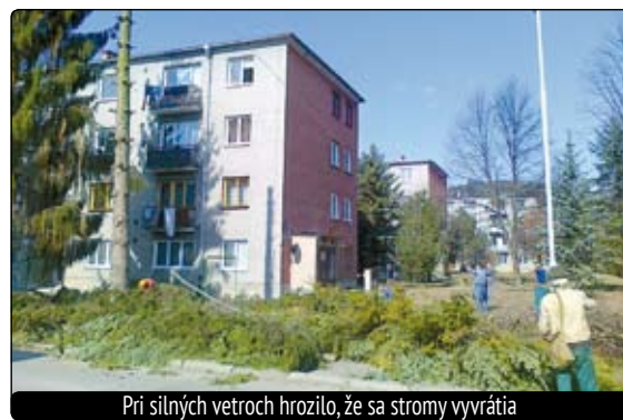
Pri silných vetroch hrozilo, že sa stromy vyvrátia

Na základe podnetu dňa 2. 3. 2012 bola vykonaná obhliadka drevín. Stromy síce boli relatívne v dobrom zdravotnom stave, ale ich veľkosť pre daný priestor bola skutočne neúnosná a svojím vzrastom zasahovali tak do elektrického vedenia ako aj do vedenia miestneho rozhlasu. Pri silných vetroch hrozilo, že sa vyvrátia a spôsobia značné škody na majetku, tiež by mohli ohroziť zdravie a život obyvateľov. Vzhľadom na to, že podnet občanov bol naozaj opodstatnený, Obec Slovenská Lupča ako príslušný správny orgán v prvom stupni ochrany prírody podľa zákona č. 416/2001 Z. z. o prechode niektorých pôsobností z or-