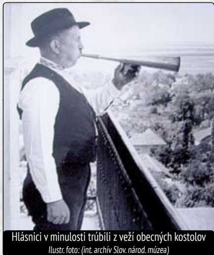
Hlásnici v minulosti trúbili z veží obecných kostolov