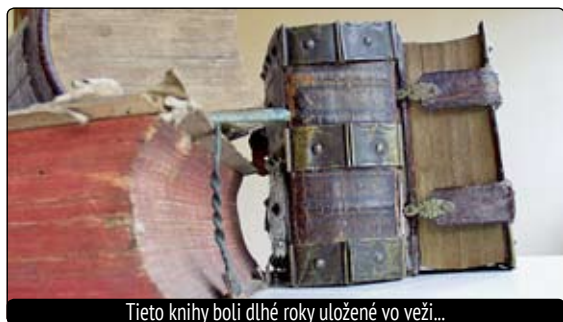
Tieto knihy boli dlhé roky uložené vo veži...