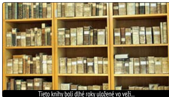
Tieto knihy boli dlhé roky uložené vo veži...