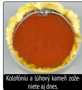
Kolofóniu a lúhový kameň zoženiete aj dnes.

Do hrnca alebo kotlíka dáme vodu, loj, kosti a lúhový kameň. Po pol hodine varenia pridáme kolofóniu. Varíme 2 – 3 hodiny, prípadne kým sa nerozpadnú kosti. Po uvarení obsah