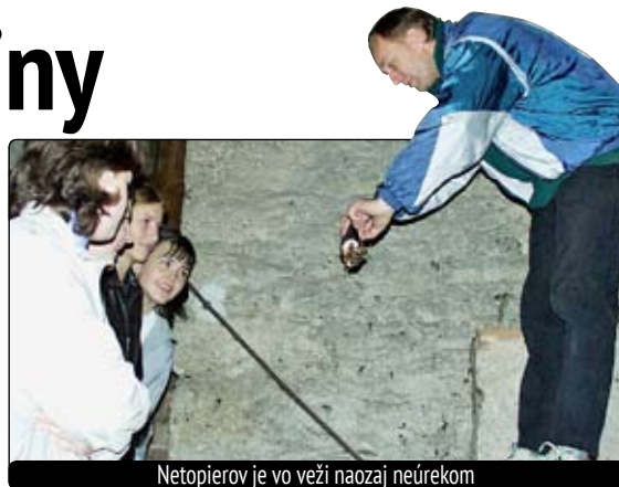
Netopierov je vo veži naozaj neúrekom

Pokrokom v meraní času bolo zostrojenie mechanických hodín. Prvé mechanické hodiny so závažím a systémom ozubených koliesok, regulujúcich chod stroja, boli zhotovené najpravdepodobnejšie v 9. storočí. Hodiny poháňala tiažová energia klesajúceho závažia, ktoré uvádzalo do pohybu ozubené súkolie. Skutočné kyvadlové hodiny boli zho-