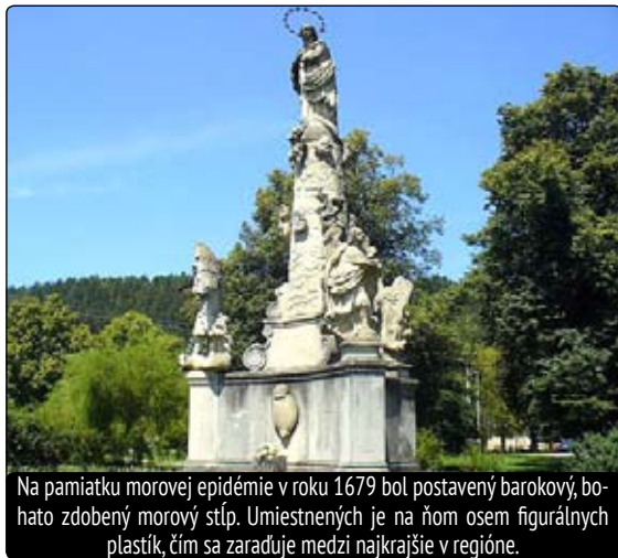
Na pamiatku morovej epidémie v roku 1679 bol postavený barokový, bohato zdobený morový stĺp. Umiestnených je na ňom osem figurálnych plastiek, čím sa zaraďuje medzi najkrajšie v regióne.

Ľupčania skladali a nakladali sudy vína do pivnice, oplotili oboru, záhrady. Počas sviatkov dve desiatky chlapov strážilo hrad a ďalších desať sprevádzalo panstvo na cestách. Od 17. storočia sú dôkazy o tom, že v Ľupči boli aj zemanovia, ktorí bývali v kúriách. O Ľupči píše aj Matej Bel v diele Notitia Hungariae (1736) a nazýva ju „Slovenskou“. V čase maďarizácie úradný názov bol Zvolenská Ľupča. Slovenskou sa stala v roku 1918.