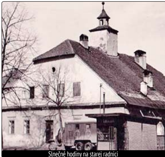
Slnečné hodiny na starej radnici

navzájom príliš neodlišoval. Podstata merania času spočívala v zisťovaní úbytku zhoreného vosku alebo parafínu, ktorý vyjadroval časové jednotky. V Egypte na meranie času využili tiažovú energiu vody a skonštruovali tzv. vodné hodiny. Voda pretekala sústavou nádob a meniaci sa výška jej hladiny alebo pohybujúci sa plavák ukazoval plynutie času. Presýpacie hodiny boli založené na podobnom princípe ako vodné hodiny. Boli nenáročnejšie na prepravu,