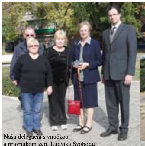
Naša delegácia s vnučkou a právnikom gen. Ludvíka Svobodu