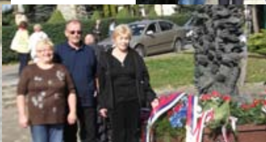
S dcérou gen. Ludvíka Svobodu