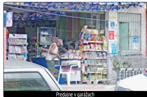
Predajne v garážach

Spolu s nimi bývali v hoteli ďalší účinkujúci – filipínsky a ruský klavirista, americká speváčka, rumunský kontrabasista a izraelský huslista. Striedali sa na koncertoch – účinkovali v kostole. „Pravdupovediac, klasická hudba tam vôbec nie je a asi ani taká kultúra, na akú sme tu zvyknutí. Ľudia si to užívali. Bolo doslova natrieskané – 800 ľudí, ba aj stoličky si doniesli a dívali sa vonku na obrazovky. Veď všetko bolo zadarmo. Publikum bolo naozaj ne-