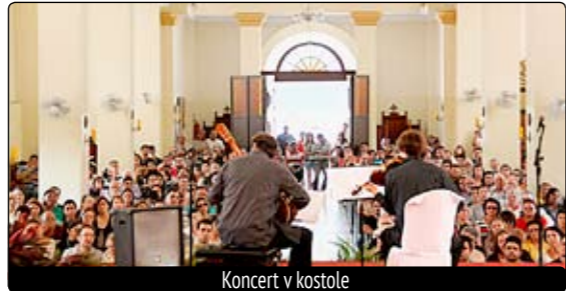
Koncert v kostole