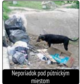
Neporiadok pod pútnickým miestom

veľmi nebezpečné“, varoval nás konzul. Turistiku si tí naši teda veľmi neužíli, no neodpustili si navštíviť támojšie pútnické miesto ku kópii Ježiša Krista, ako je v Rio de Janeiru. „Tu ale ľudia boli hrozni, ale to je môj pohľad, lebo okolo sa váľali odpady.“ Keďže tu prevláda portugalcina, naši mladí hudobníci nerozumeli na ulici nič a anglicky rozprávali iba organizátori.