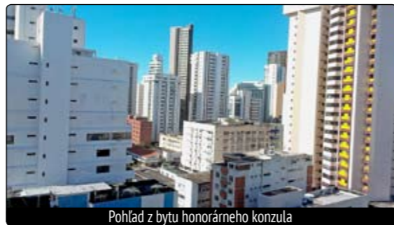
Pohľad z bytu honorárneho konzula

Podnebie Brazílie ovplyvňuje suchá buš vo vnútrozemí, dažďový prales v amazonskej oblasti a, samozrejme, aj rozsiahle pláže na východnom pobreží, a tak ide oblastne o veľmi odlišnú klimu. Teploty na juhu sú miernejšie. Od januára do apríla je na severe obdobie dažďov, na severovýchode však pretrvávajú od apríla do júla a od novembra do marca. Striedajú sa tu vlastne dve ročné obdobia – zima a leto. Aj pobyt našich hudobníkov bol poznačený „zimou“ a dažďom. „Teploty sa pohybovali od 26 do 28 stupňov,“ usmieva sa nad brazílskym ponímaním slo-