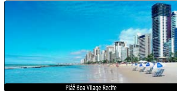
Pláž Boa Vilage Recife