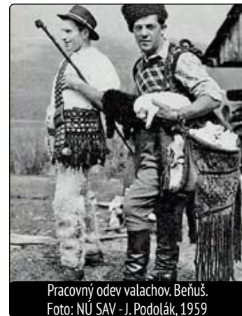
Pracovný odev valachov. Beňuš. 1959