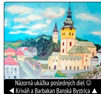
Názorná ukážka posledných diel © ◀ Kriváň a Barbakan Banská Bystrica ▶