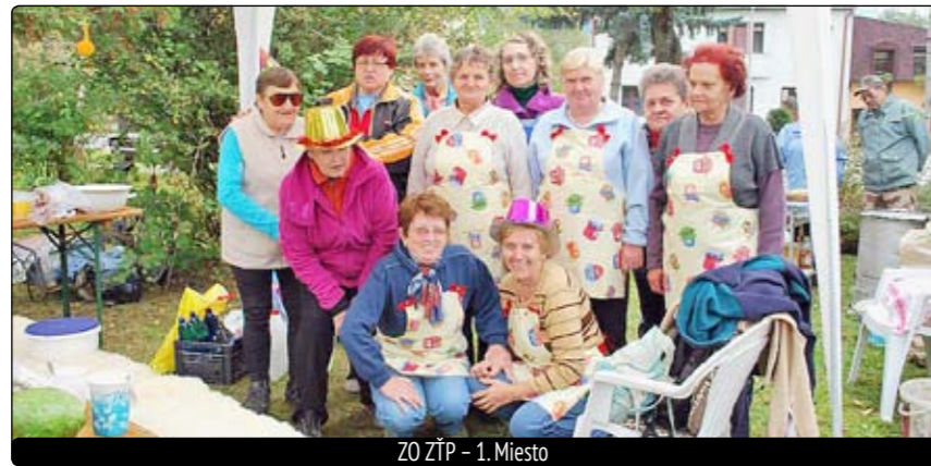
ZO ZŤP – 1. Miesto