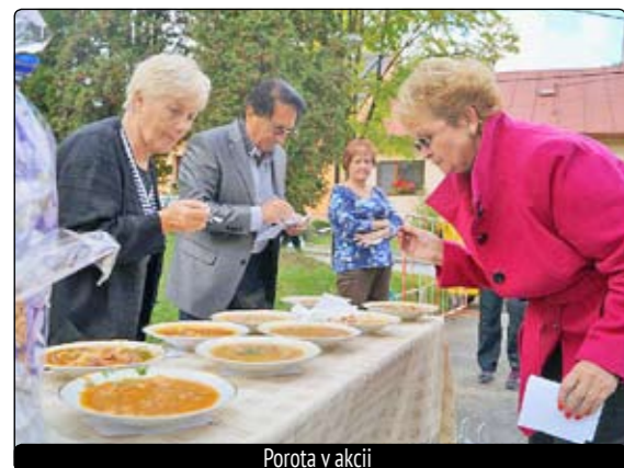
Porota v akcii