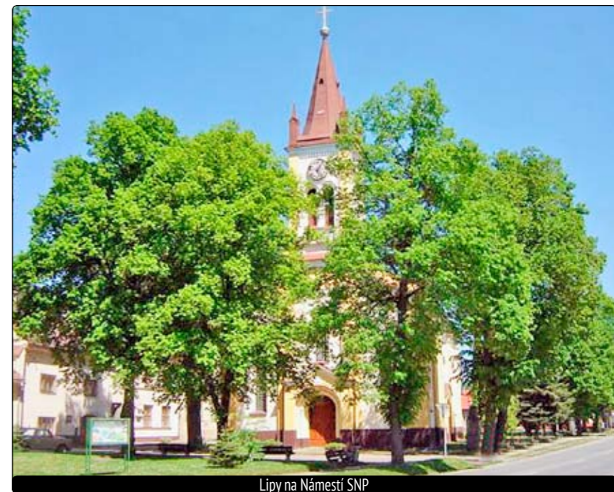
Lipy na Námestí SNP