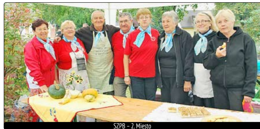
SZPB – 2. Miesto