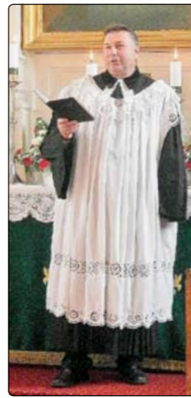
Autor: Lucia Grofčíková

Počas služieb Božích sa nedalo vyhnúť slzám dojatia. Pri bilancii a ďakovných slovách od zborovej dozorkyne a zborového podzorku o všetkom, čo sa v zbore za uplynulých 20 rokov podarilo, sa dojatiu nevyhol ani samotný „oslávenec“ zborový farár. I jemu vykl-