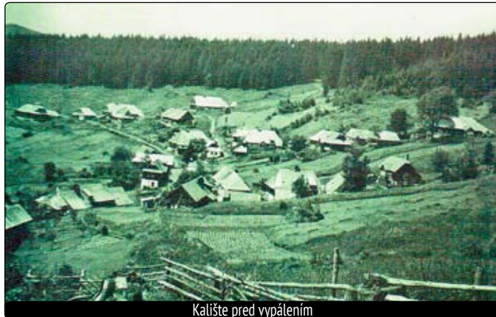
Kalište pred vypálením

Dnes je národnou kultúrnou pamiatkou a marcovú tragédiu pripomína pamätník obetiam, zničená osada sa premenila na miesto piety a spomienok. Svojou atmosférou pohltí každého návštevníka. Na všetkých vypálených domoch sú tabuľky s menami a osudmi ich bývalých obyvateľov. Stačí si ich pre-