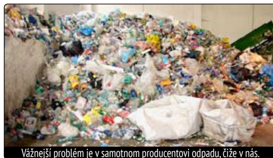
Vážnejší problém je v samotnom producentovi odpadu, čiže v nás.

Toto je však len jedna časť problému odpadu. Tá druhá, vážnejšia je v samotnom producentovi odpadu, čiže v nás. Už som raz napísal, že moja päťčlenná rodina si plne vystačí s jednou 110 l „KUKA“ nádobou týždenne, a preto nechápem, kde sa u iných ten všetok odpad berie. Stačí sa mi prejsť každý pondelok napríklad iba po Námestí SNP a nejdem sa vynačudovať dvom trom i viacerým nádobám pred jednotlivými domami. A akoby to nestačilo, nachádzajú sa pri nich ešte aj ďalšie vrecia s odpadom. Toto všetko už nie je len o poriadku, ale hlavne o peniazoch. Aj tu ako pri iných činnostiach musí platiť zásada, že ak produkuješ viac odpadu, musíš aj viac zaplatiť.