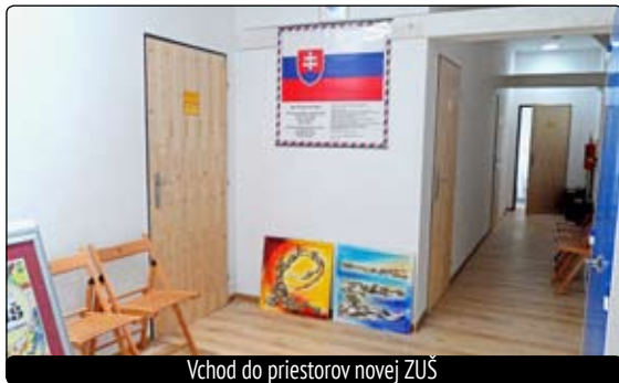
Vchod do priestorov novej ZUŠ

Školský rok 2013/2014 v Základnej umeleckej škole v Slovenskej Lupči začal skutočne radostne. Po rozsiahlej rekonštrukcii a výstavbe môžu malí budúci umelci tvoriť v preobnovených podkrovových priestoroch ZUŠ. Stavba bola ukončená tesne pred začiatkom školských povinností, aby sa deti mohli „nastahovať do nového“.