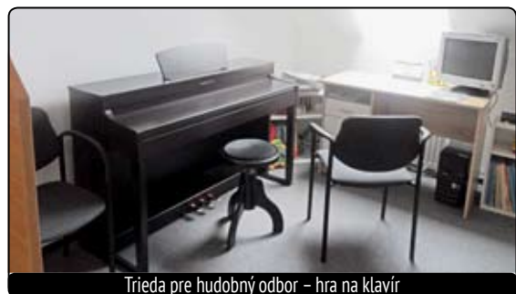
Trieda pre hudobný odbor – hra na klavír

Vedenie ZUŠ vytvorilo pre všetkých nadšencov umenia desať úplne nových nepriechodných tried. Vyučuje sa v nich hra na hudobných nástrojoch v hudobných odboroch. Okrem toho majú deti výtvarnú triedu pre výtvarný odbor, triedu pre literárno-dramatický odbor. Vyučovanie tanečného odboru sa stále realizuje v miestnom kultúrnom stredisku. V budúcnosti by však vedenie ZUŠ chcelo vytvoriť tanečnú a koncertnú sálu priamo v priestoroch školy.