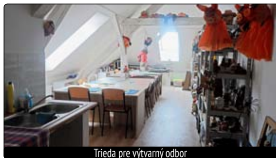
Trieda pre výtvarný odbor