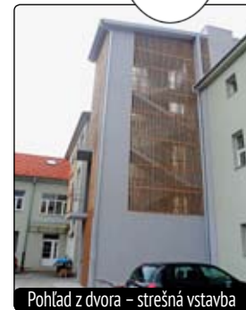
Pohľad z dvora – strešná vstavba

V súčasnosti navštevuje tunajšiu Základnú umeleckú školu 348 žiakov. V porovnaní s minulým školským