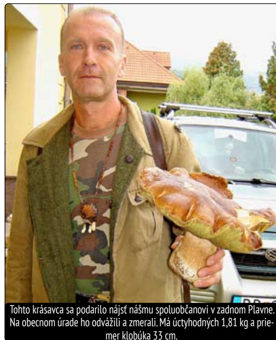
Tohto krásavca sa podarilo nájsť nášmu spoluobčanovi v zadnom Plavne. Na obecnom úrade ho odvážili a zmerali. Má úctyhodných 1,81 kg a priemer klobúka 33 cm.

Huby nemajú chlorofyl, a preto nemôžu žiť z nerastných látok. Pre svoj život potrebujú ústrojné látky, ktoré tvorili rastliny alebo živočíchy. Preto huby nachádzame najmä v lesoch, kde je veľké množstvo hnojúcich organických látok, ktoré im poskytujú výživu. Najvýznamnejšia činnosť húb v prírode spočíva v tom, že rozkladajú organické hmoty a vracajú opäť do ovzdušia uhlík v podobe CO 2 , ktorý môžu zelené rastliny prijímať a tvoriť z neho svoje telá. Podľa spôsobu života rozdeľujeme huby na saprofytické a parazitické. Väčšina húb žije saprofytickým spôsobom, čo znamená, že čerpajú výživu najčastejšie z mŕtvych častí rastlín (lesný humus, odumreté drevo, lístie a pod.). Niektoré