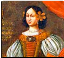
Mária Séciová, nazývaná „Muránska Venuša“. Bola nielen krásna a múdra, ale vraj aj chamtivá a veľmi ctižiadostivá.