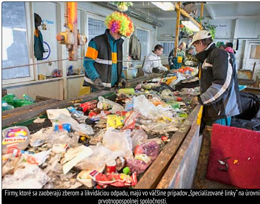
Firmy, ktoré sa zaoberajú zberom a likvidáciou odpadu, majú vo väčšine prípadov „špecializované linky“ na úrovni prvotnopospolnej spoločnosti.