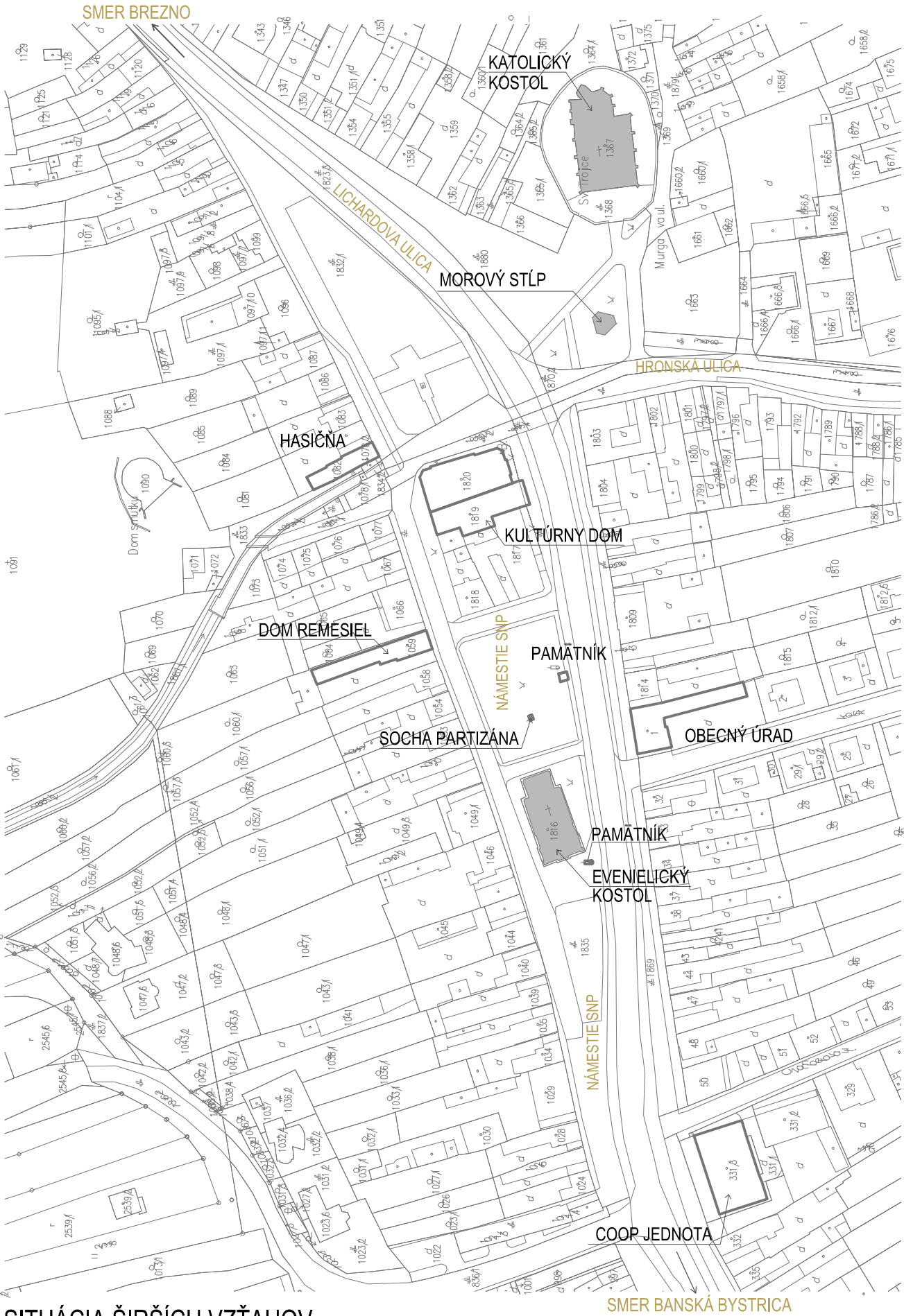
SITUÁCIA ŠIRŠÍCH VZŤAHOV